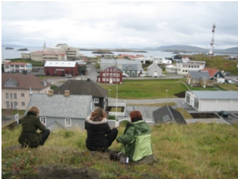
Útsýni yvir Stykkishólm.