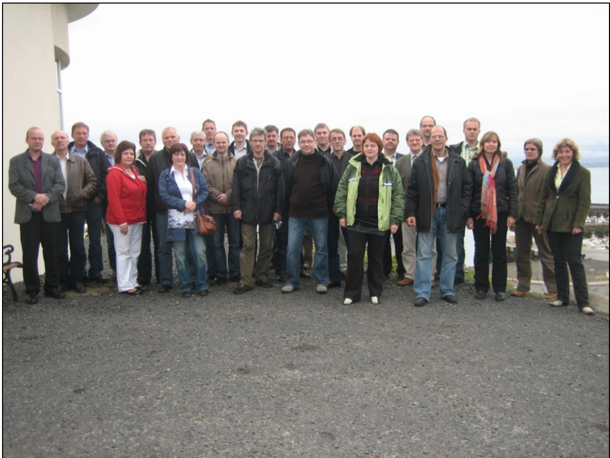
30 fólk frá kommununum luttóku á ferðini. Her eru luttakararnir samlaðir í Stykkishólmi.