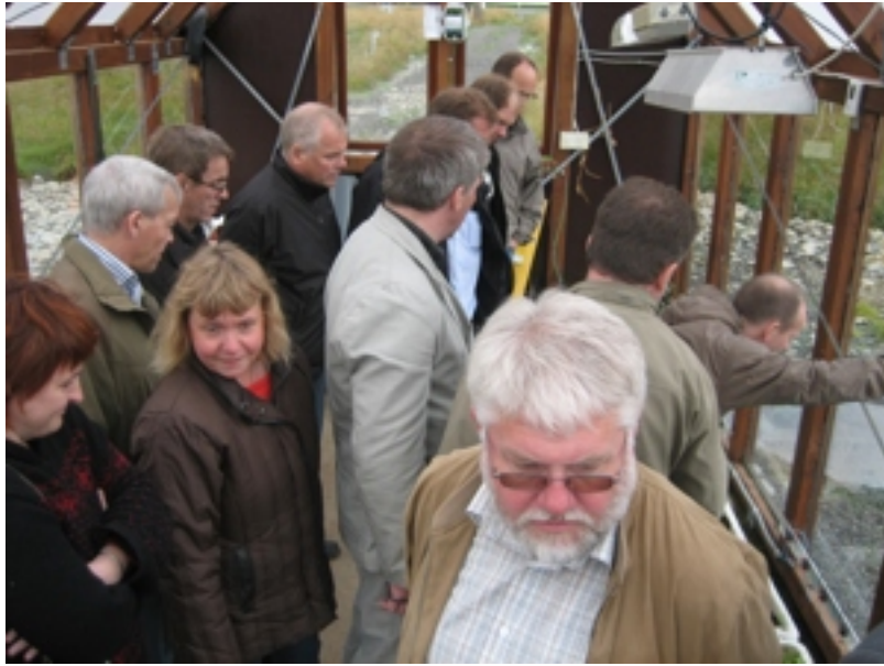
Inni í vakstarhúsinum. Trongt, men tó áhugavert.