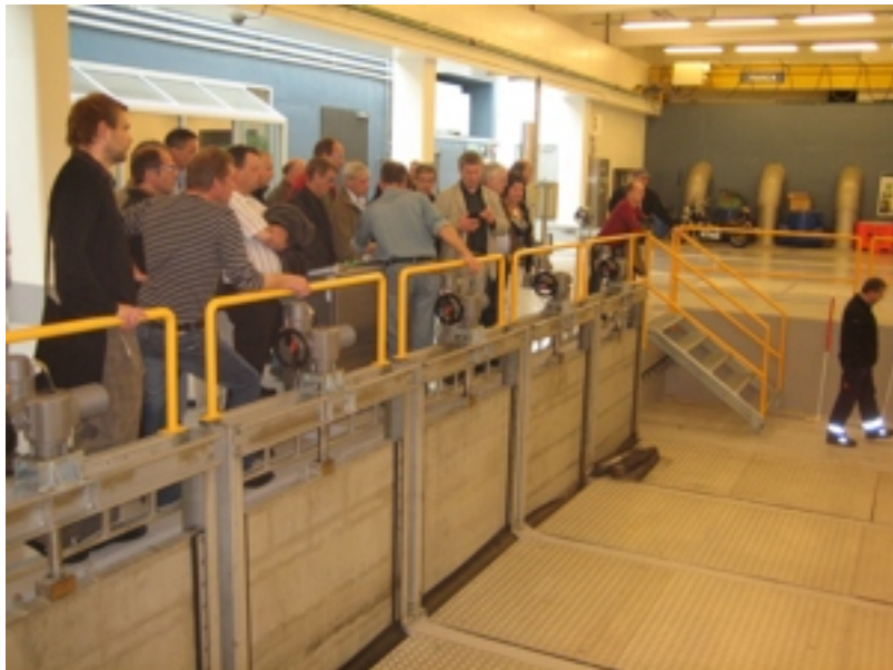
Leiðarin á pumpustøðini greiðir frá hvussu spillivatnið verður reinsað.

Síðan varð vitja á pumpustøð, sum Reykjavíkar kommuna rekur saman við grannakommunum. Á støðini verður alt kloakk- og spillivatn í hovuðsstaðarøkinum reinsað og síðan pumpað 5,5 km. út á hav.