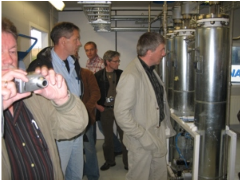
Luttakarar kunna seg um hvussu rusk kann blíva til náttúrugass á metan-gassverkinum tætt við tyrvingarplássið.