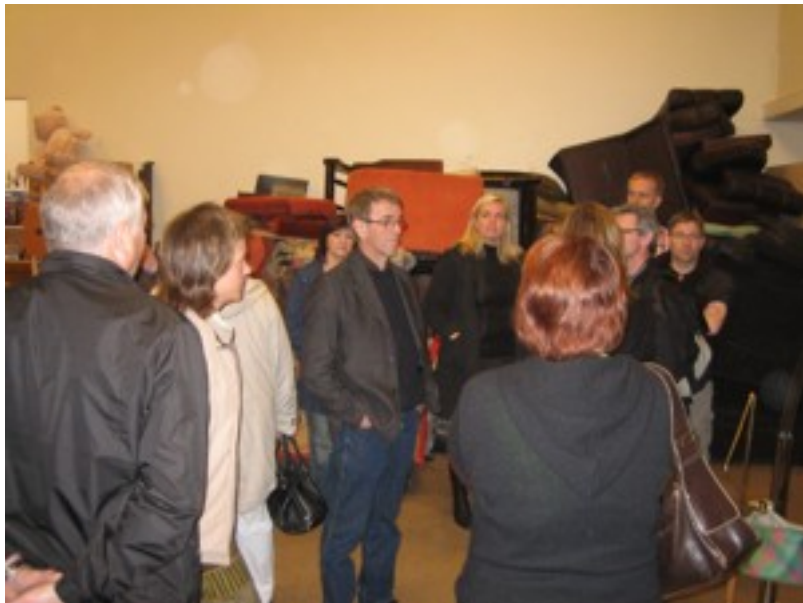
Á lagrinum á "Góða hirðanum".