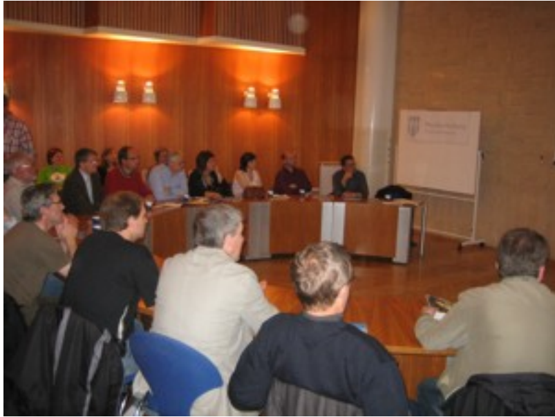
Framløgan fór fram í gamla býráðssalinum í Reykjavík.

Síðan varð vitja á pumpustøð, sum Reykjavíkar kommuna rekur saman við grannakommunum. Á støðini verður alt kloakk- og spillivatn í hovuðsstaðarøkinum reinsað og síðan pumpað 5,5 km. út á hav.