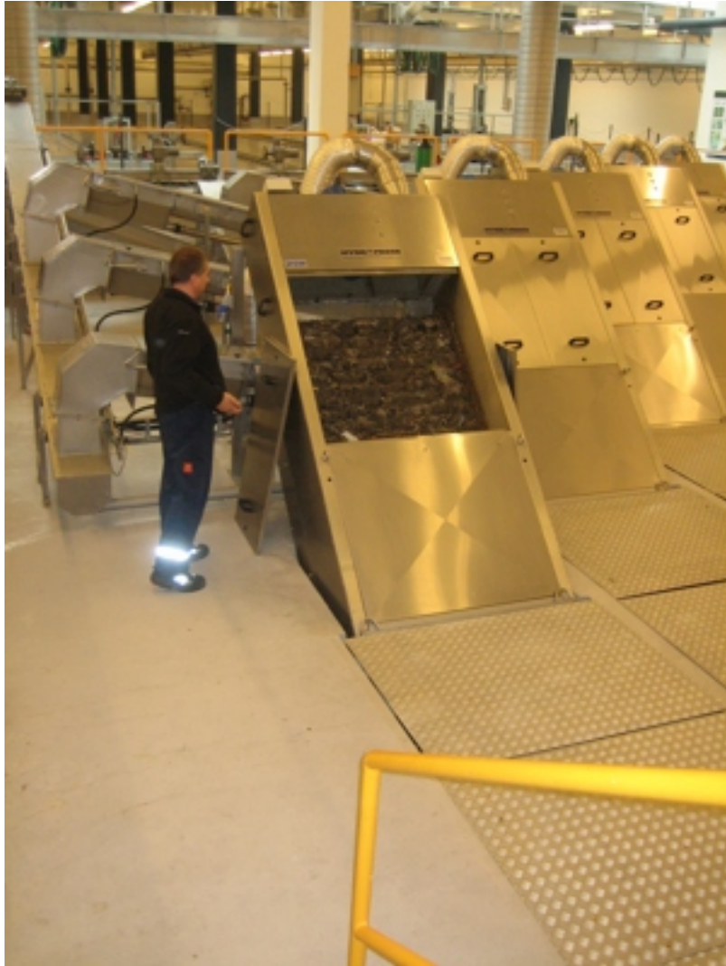
Eitt av stóru filtrunum, sum eru partur av reinskípanini á støðini.

Seinna vitjanin hendan dagin var hjá renovatiónsfelagsskapinum í høvuðsstaðarøkinum, Sorpa. Vitja varð á endurnýtsluhandlinum “Góði hirðin”, sum selur brúkiligar lutir, ið annars vóru tveittir burtur, á staðnum har burturkastið úr høvuðsstaðarøkinum verður tyrvt og á verki, sum ger metangass úr tyrvda ruskinum. Býarbussarnir í Reykjavík koyra allir uppá metan.