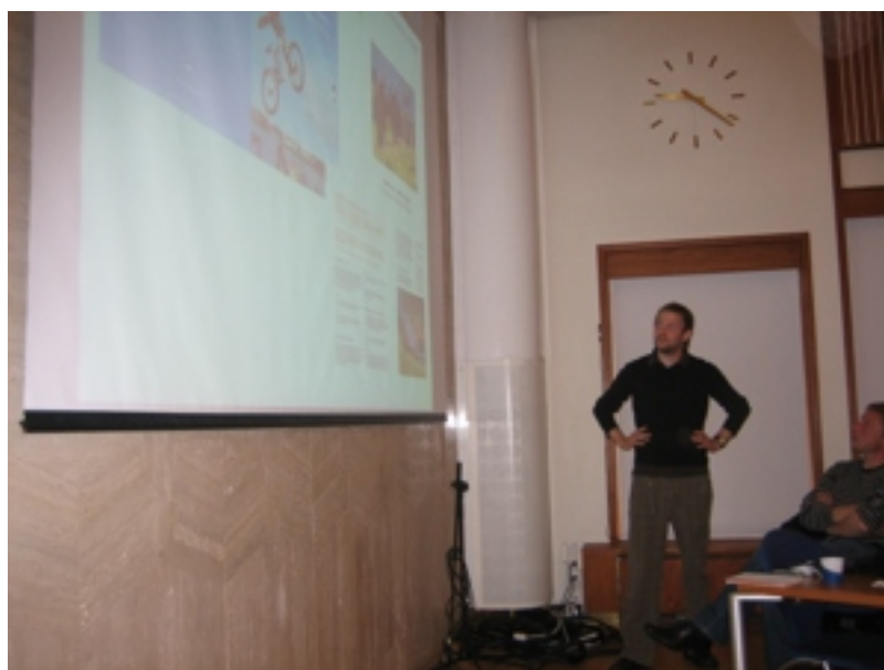
Fulltrúi á umhvørvisskrivstovuni greiðir frá um “Tey 10 grønu stigini”.

Fyrsta vitjanin var á umhvørvisskrivstovuni hjá Reykjavíkar kommunu har greitt varð frá um lokalu Agenda 21 ætlanina hjá kommununi, “Tey 10 grønu stigini”, sum borgarar og politikarar høvdu arbeitt við at fremja. Tey 10 stigini handlaðu m.a. um at fáa fólk at koyra meiri við býarbussunum, at gera súkluteigar í býnum, varðveita náttúru, planta trø og at fáa grønar skúlar og barnagarðar upp at standa.