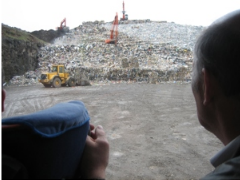
So nógv rusk fðrir okkara nútímans liviháttur til. Ruskdungi á tyrvingarplássinum norðanfyri Reykjavík.