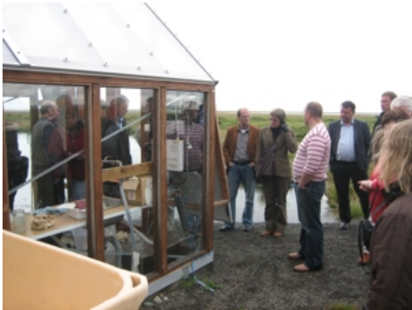
Á vitjan á Grøna skúlanum í Lýsuhól. Sveiney, sum var tulkur á ferðini, greiðir frá um vakstarhúsið á skúlanum. Skúlin ger sjálvur streym til vakstarhúsið við vatn- og sólarmegi. Næmingar, lærarar og foreldur hava bygt alt hettar og halda tað viðlíka.