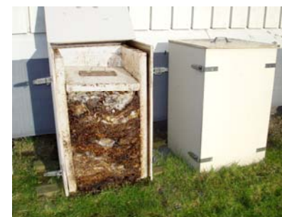
Ílöt til sankutøð í Vestmanna skúla. Ílötini eru bjálvaði við flamingoplátum og framsíðan er til at taka frá. Hetta lættir um, tá ílötini skulu tømast.

Ymist er, hvussu nógv taðing ymsar plantur skulu hava. Á baksíðuni er ein stutt vegleiðing um, hvussu taðast skal við sankutøðum.